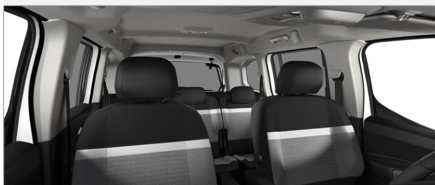
Sitze in schwarzem Stoff / grau meliertem Stoff