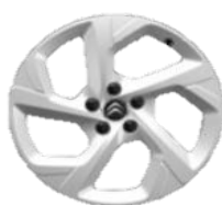
Jantes alu 18" SWIRL Gris Eclat Brillant