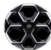
Jantes aluminium 17" ATACAMITE MAX