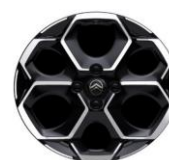
17" Alufelgen Atacamite MAX