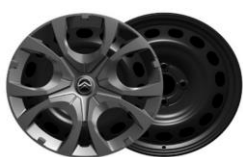
16" Radzierdeckel Pyrite YOU