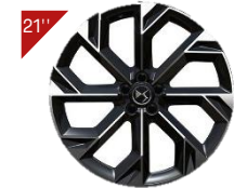
Jantes alliage BROOKLYN Code: ZHYA

■ : équipement de série / - : non disponible / * sauf sur PLUG-IN HYBRID 4x4 360 / ** seulement sur motorisation PLUG-IN HYBRID 4x4 360