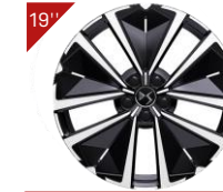
Jantes alliage EDINBURGH Code: ZHWO