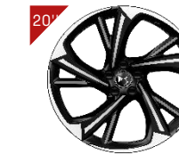
Jantes alliage ALEXANDRIA Code : ZHVZ