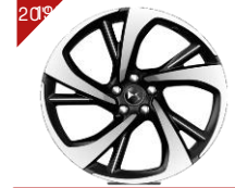
Jantes alliage TOKYO Code: ZHFK