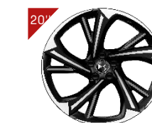
Cerchi in alluminio: ALEXANDRIA Code: ZHVZ