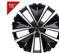
Cerchi in alluminio EDINBURGH Codice: ZHWO