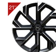
Cerchi in alluminio: BROOKLYN Codice: ZHYA

■ : equipaggiamento di serie / - : non disponibile / * Non disponibile su PLUG-IN HYBRID 4x4 360/ ** solo su motorizzazione PLUG-IN HYBRID 4x4 360