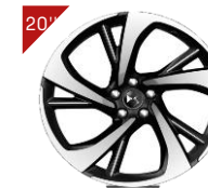
Cerchi in alluminio TOKYO Codice: ZHFK