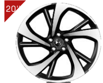
Aluminium Felgen TOKYO Code: ZHFK