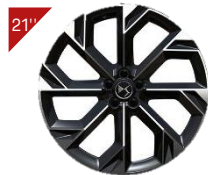
Aluminium Felgen BROOKLYN Code: ZHYA

■ : Serienausstattung / - : nicht verfügbar / *nicht verfügbar für PLUG-IN HYBRID 360 / **nur bei PLUG-IN HYBRID 4x4 360