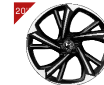
Aluminium Felgen ALEXANDRIA Code: ZHVZ