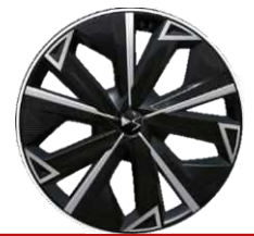
Jantes aluminium 21" CASSIOPEIA Code: ZIBF

■ : De série / - : indisponible / *disponible uniquement sur Long Range / **: non disponible sur Long Range 4x4 350