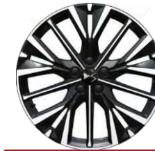
Jantes aluminium 20" LYRAE Code: ZIBD