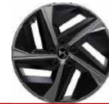
Jantes aluminium 19" BOREALIS AERO Code: ZIBC