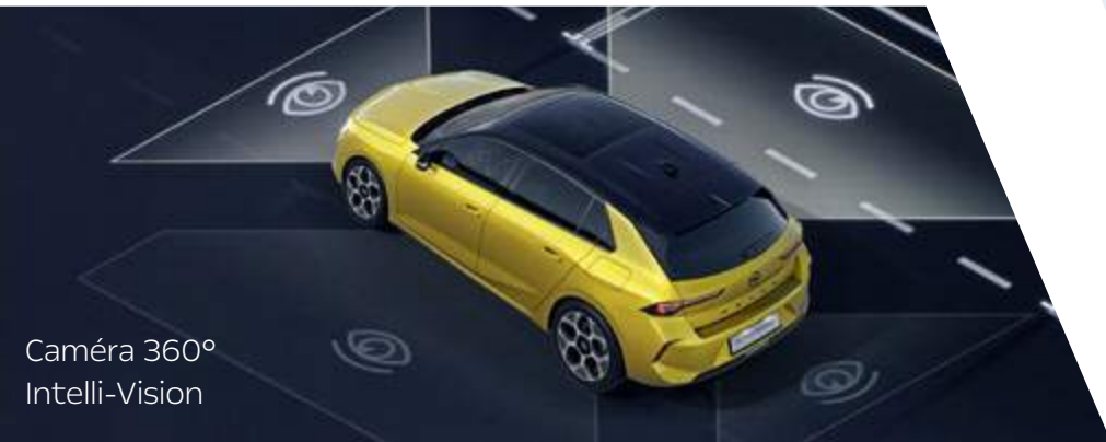
Caméra 360° Intelli-Vision