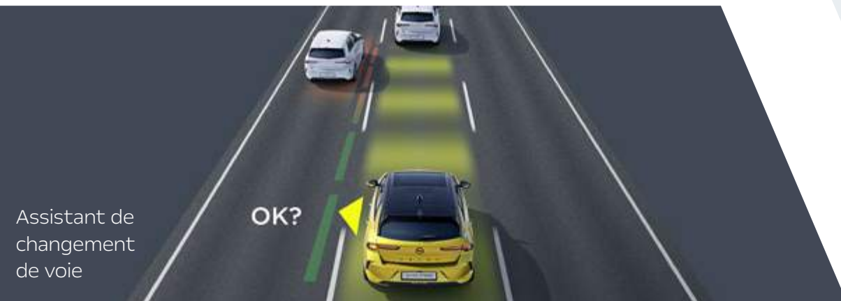
Assistant de changement de voie