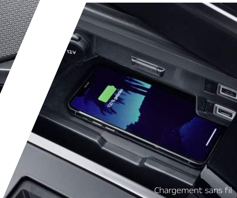
Chargement sans fil

La nouvelle surface graphique du système d'infodivertissement intègre ton smartphone sans câble, via Apple CarPlay™ 1 ou Android Auto™ 2 , réagit aux commandes vocales et simplifie la navigation en direct avec les mises à jour de cartes Over-the-Air.