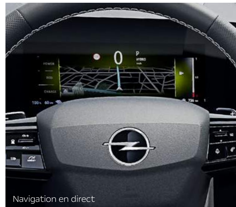
Navigation en direct

Retrouve d'autres informations concernant le système de navigation ainsi que des instructions pour l'activation des services de connectivité sur www.opel.ch