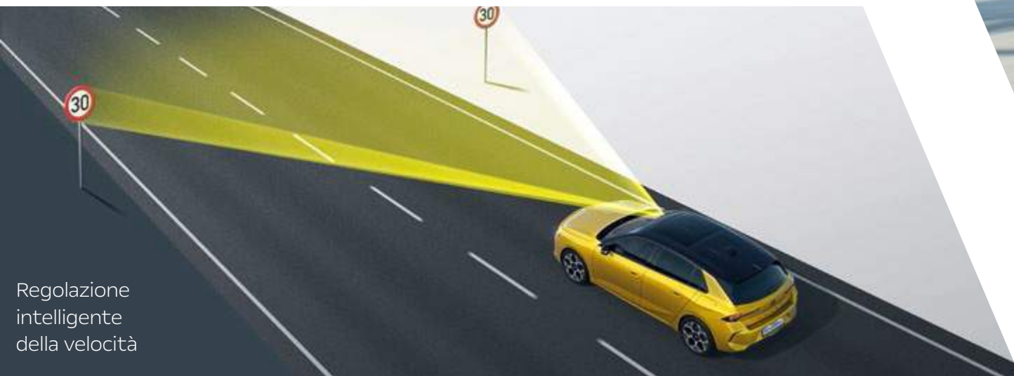
Regolazione intelligente della velocità