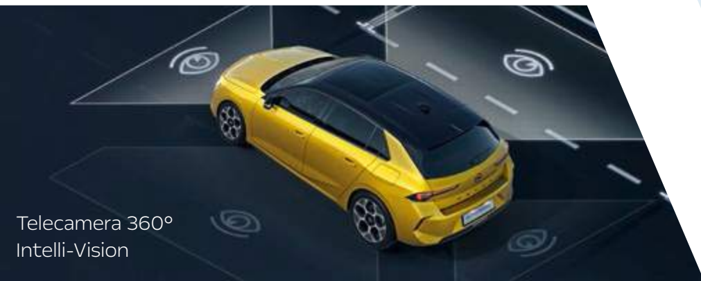
Telecamera 360° Intelli-Vision