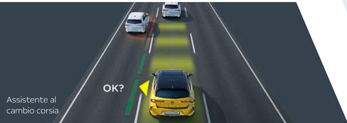
Assistente al cambio corsia