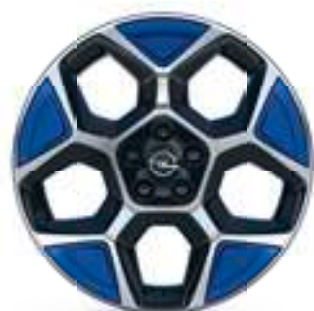
Radspeichenclips (4er-Set) Kobalt Blue Teilenummer: 98448921SM