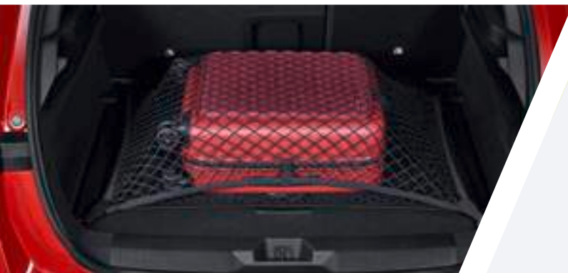
Laderaumnetz, universal Teilenummer: 24462198