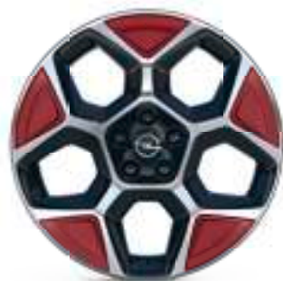
Radspeichenclips (4er-Set) Kardio Red Teilenummer: 98448921PQ