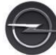
Radnabenabdeckung Kaliber Grey (matt) Teilenummer: 98387470XS