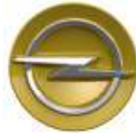
Radnabenabdeckung Kult Yellow Teilenummer: 98387470RV