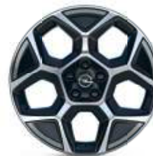
Radspeichenclips (4er-Set) Kaliber Grey (matt) Teilenummer: 98448921XS