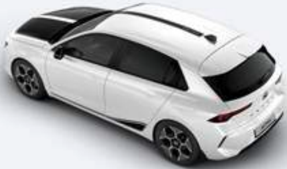
Autoaufkleber Motorhaube, Schwarz