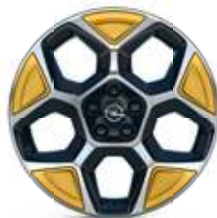
Radspeichenclips (4er-Set) Kult Yellow Teilenummer: 98448921RV