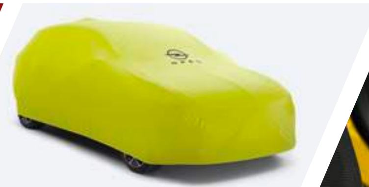
Schutzbezug innen (Größe 4) Teilenummer: 1681344180