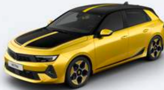
Autoaufkleber Motorhaube, Schwarz