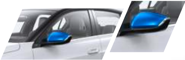
Aussenspiegelblenden Kobalt Blue Teilenummer: 98413999SM