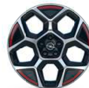
Radspeichenclips (4er-Set) Black with Red Accent Teilenummer: 984489211N