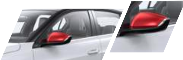
Aussenspiegelblenden Kardio Red Teilenummer: 98361535PQ