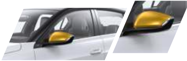
Aussenspiegelblenden Kult Yellow Teilenummer: 98413999RV