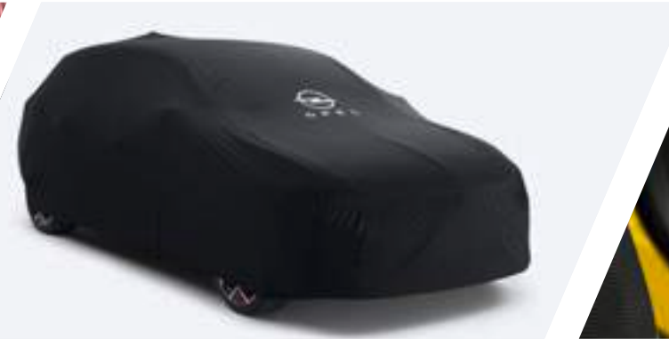
Schutzbezug innen (Größe 2) Teilenummer: 1681343780