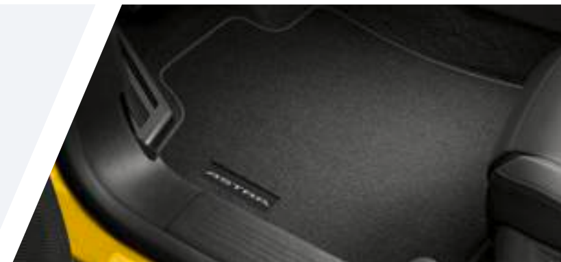
Fussmatten, Velours Teilenummer: 1674714080