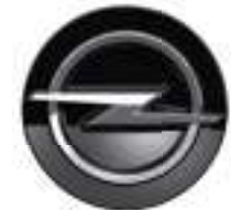
Radnabenabdeckung Hochglanzschwarz Teilenummer: 98387470XY