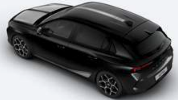
Autoaufkleber Motorhaube, Grau (matt)