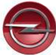
Radnabenabdeckung Kardio Red Teilenummer: 98387470PQ