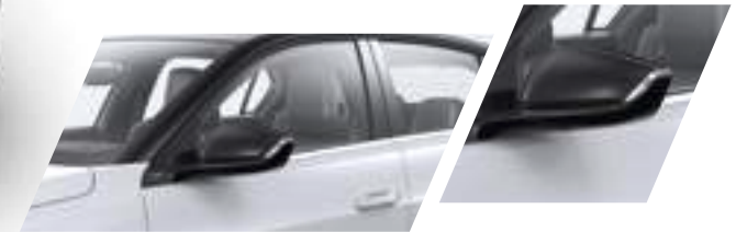
Aussenspiegelblenden Carbon Finish Teilenummer: 98414000XX