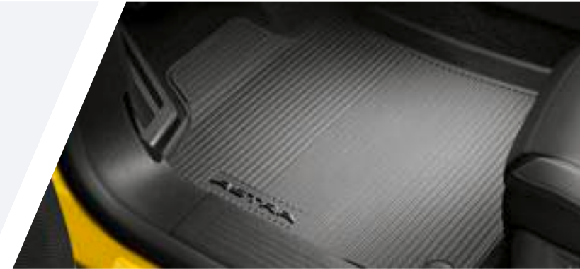
Fussmatten, Allwetter (Gummi) Teilenummer: 1674712480