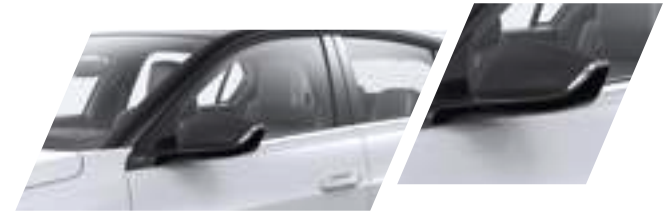
Aussenspiegelblenden Kaliber Grey (matt) Teilenummer: 98445343XS