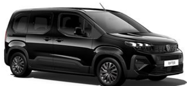
Noir Perla Nera